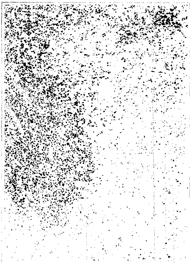
Figura 2. Aspecto microscópico indicativo de la presencia de amplias áreas de necrosis (HE, original \times 40 ).

observada por otros autores (2). Esto se explica al englobar sus series síndromes linfoproliferativos polimorfos en general que incluyen hiperplasias reactivas y síndromes linfoproliferativos polimorfos.