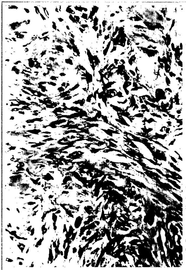
Figura 2. Tumor formado por células fusiformes con núcleos elongados y ondulados adoptando un patrón fasciculado. Se observa una mitosis atípica (flecha) (original, HE \times 200 ).