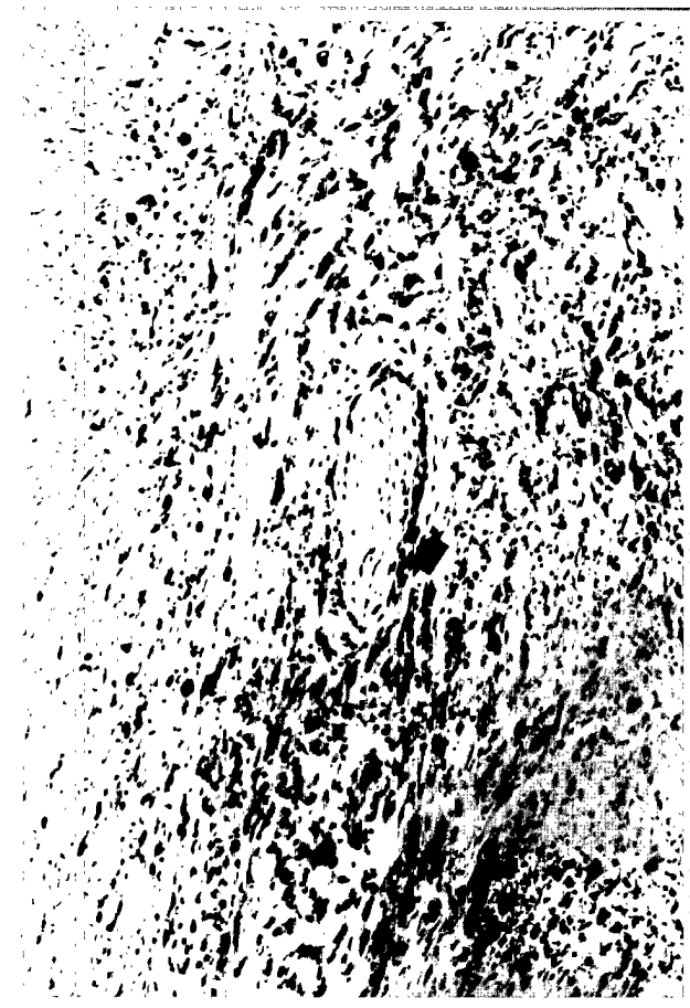
Figura 3. Fascículo nervioso (flecha) englobado por el tumor (original, HE \times 100 ).

parótida, partes blandas y un ganglio linfático periglandular. Había mayor grado de atipia y pleomorfismo nuclear, y se observaban gruesos troncos nerviosos englobados por la tumoración (Fig. 3).