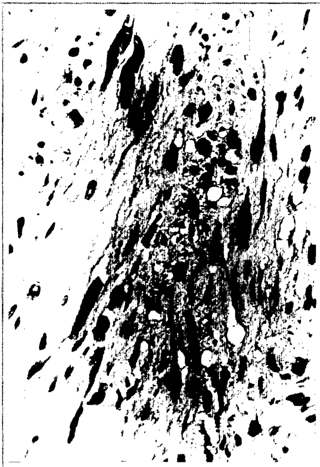
Figura 4. Células tumorales que muestran inmunorreactividad para la proteína básica de la mielina.

rofibroma, evidencia ultraestructural de diferenciación de células de Schwann con ausencia de premelanosomas y presentar inmunorreactividad con al menos dos de los siguientes antígenos: proteína S-100, Leu 7, proteína básica de la mielina y proteína glial fibrilar ácida. Además el tumor no debe expresar queratina.