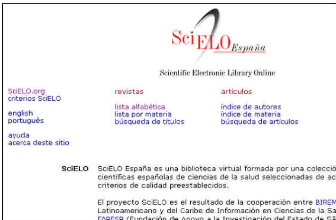
Figura 5. SciELO

Biblioteca de revistas electrónicas españolas a texto completo (SciELO España – Scientific Electronic Library On-line), con posibilidad de hacer búsquedas en la colección (figura 5).