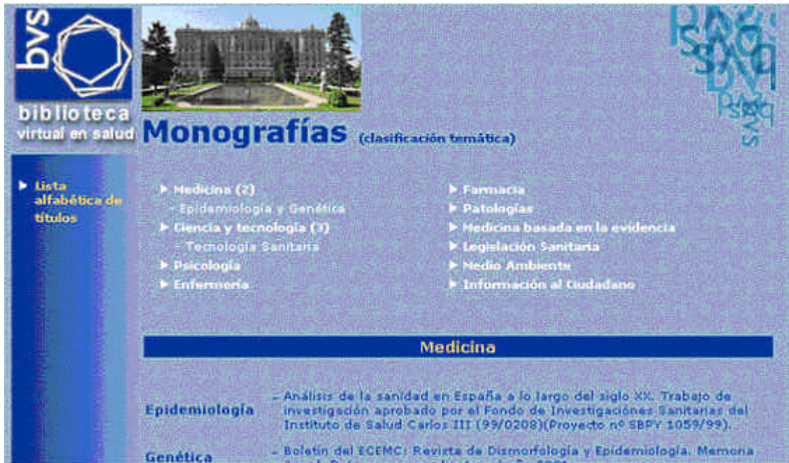
Figura 6. Monografías y boletines a texto completo

☞ Monografías y boletines a texto completo, lanzada en Febrero de este año (figura 6).