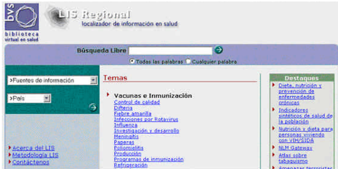
Figura 4. Localizador de Información en Salud

Biblioteca de revistas electrónicas españolas a texto completo (SciELO España – Scientific Electronic Library On-line), con posibilidad de hacer búsquedas en la colección (figura 5).