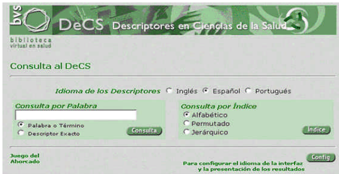
Figura 3. Tesoro DeCS