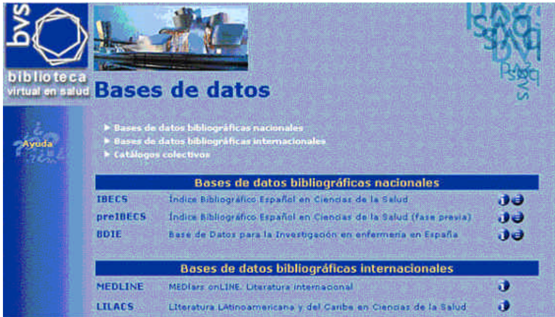
Figura 2. Bases de datos bibliográficas